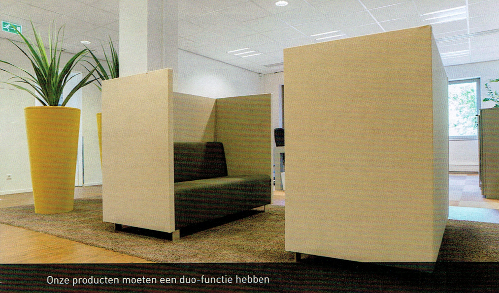
Onze producten moeten een duo-functie hebben

“Na een periode van ontwerpen en een zoektocht naar de geschikte ambachtspartijen, hebben we in verschillende kleine dorpjes rond het centraal gelegen Gorinchem de geschikte leveranciers gevonden. Onze producten worden echt letterlijk gemaakt ‘onderaan de dijk!’ Nederlander kan haast niet. Voor de ontwikkeling van de geluidsabsorberende schuimen in onze producten werken we bijvoorbeeld nauw samen met Merford. Zij leveren volgens de eisen die we samen met hen hebben geformuleerd en hebben getest. Ook het duurzame aspect verliezen we niet uit het oog,” aldus Claassen. “Door regionaal te produceren hebben we nauwelijks transport en dus ook een forse reductie van uitstoot. Nog een leuk voorbeeld is de wolvilten bekleding die we gebruiken op basis van de ‘second nature’ filosofie, het vilt is gemaakt van PET-flessen.”